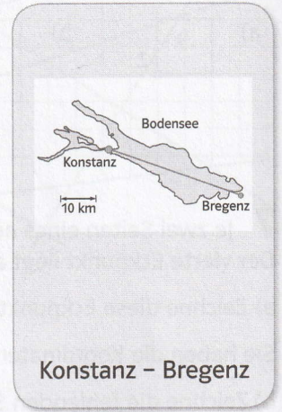
Konstanz - Bregenz