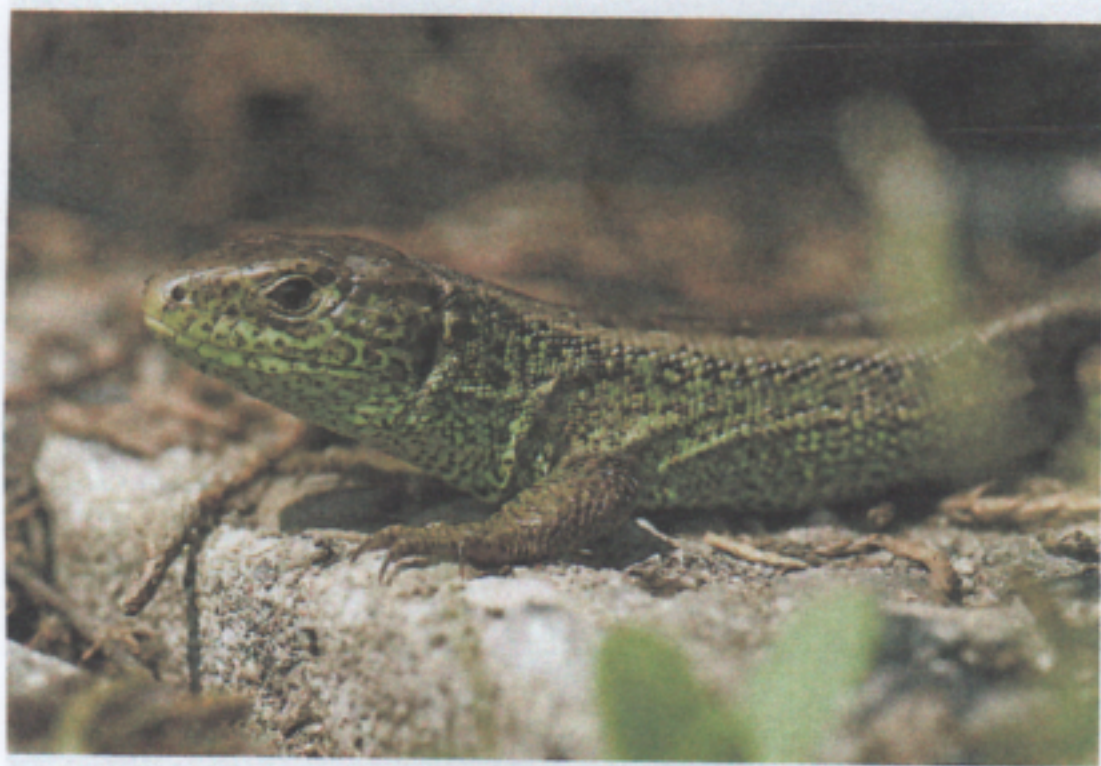
3 Licht und Wärme von der Sonne

Die Sonne versorgt die Erde mit Licht und Wärme. Daher ist Leben auf der Erde möglich.