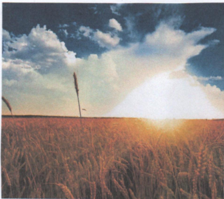
1 Die Sonne lässt die Pflanzen wachsen.